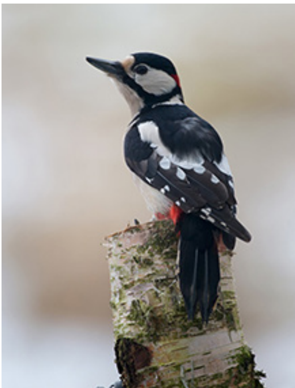
Större hackspett.

Den femte träffen handlar om vad de lokala/regionala fågelföreningarna kan erbjuda i form av exkursioner, föredrag och andra aktiviteter, men också om vilket fågelskyddsarbete som de bedriver. BirdLife Sveriges aktiviteter samt nationellt och internationellt fågelskyddsarbete uppmärksammas. Hur kan ni som deltagare bidra till att värna om fåglarna?