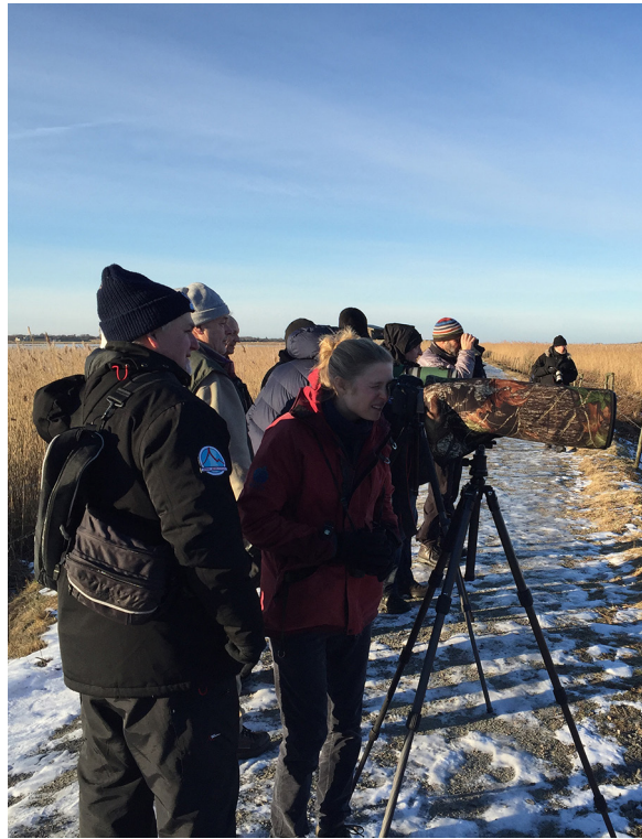
Tubkikare kan vara bra att ha när man skådar på långa avstånd.