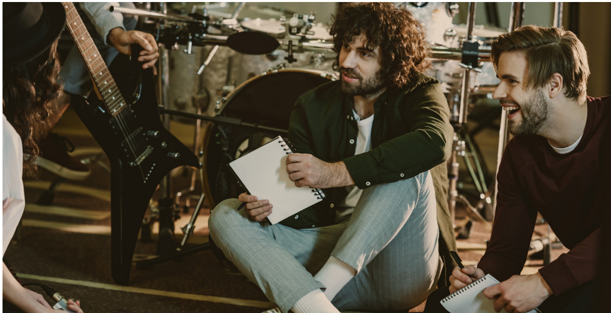
Prata ihop er angående hur ni ska sprida er musikvideo och gör en plan för marknadsföringen.

Ni har väl en Facebook-sida och ett Instagram-konto för gruppen? Om inte, skaffa det genast! Lägg ut videon där, och flera teasers innan och påminnelser efteråt.