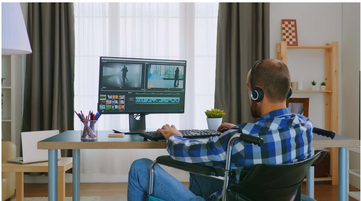
Det finns många olika programvaror för redigering som ni kan välja mellan.

Ibland har man filmat i ett rått format (tunga filer med hög kvalitet). Datorn hänger sig lätt då. Men det går att omvandla filer. Då är det viktigt att tänka på att för mycket omvandling kan leda till sämre bildkvalitet. Proffsprogram brukar ha funktionen att jobba med proxyfiler, dvs mindre tunga kopior av originalfilen, som man sen byter ut vid utmix.