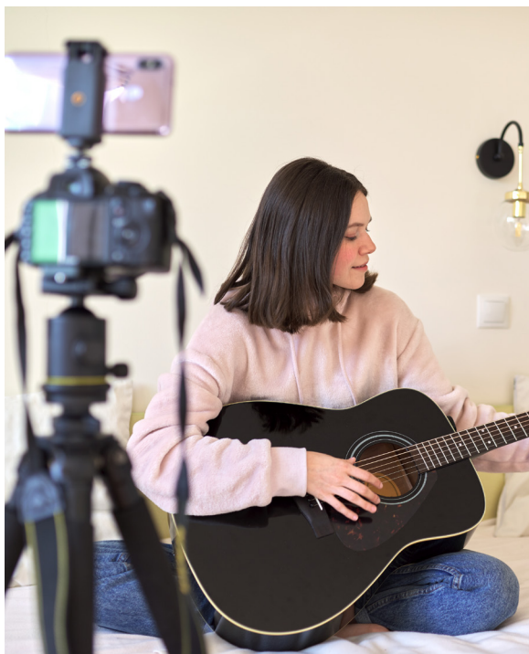
Att filma mer dokumentärt och enkelt är också ett alternativ.

Självklart kan man vara mer spontan och filma på måfå. Det ger en mer dokumentärfilmsliknande känsla. Allt beror på vad ni tänker er för typ av slutprodukt. Ostrukturerat filmande brukar dock leda till förvirrade tittare. Dramaturgi har fungerat sen urminnes tider.