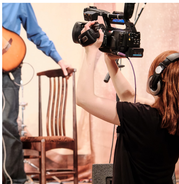
Anlita proffs? Ni hittar regissörer, filmfotografer, ljussättare m.m. på företag, i skolor eller genom forum på nätet.