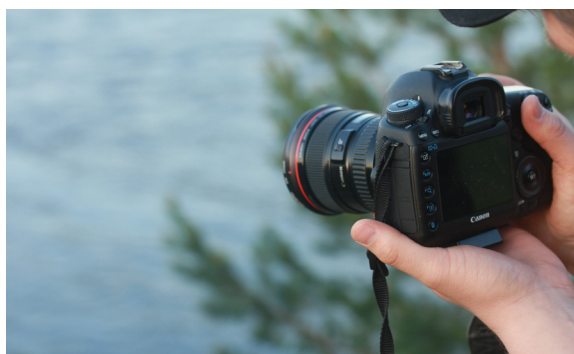
Systemkamera med filmfunktion.