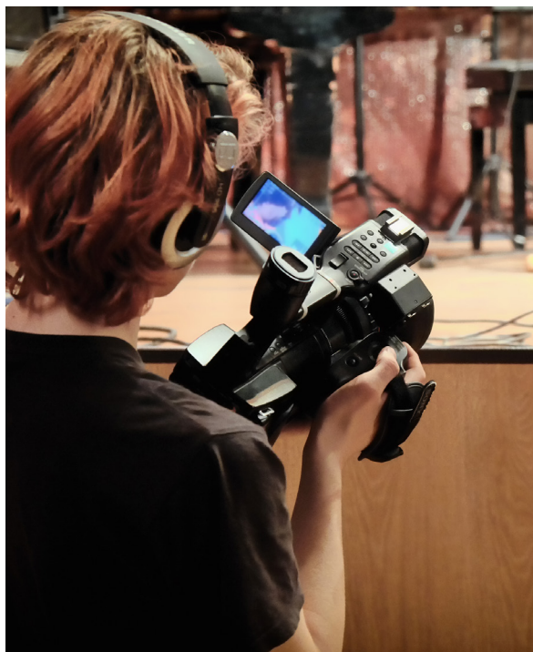
Se till att ni har mycket inspelat råmaterial att klippa i.

Den som klipper bör ha viss känsla för musik och rytm och vara bra på att se när det är dags att klippa, vilka bilder/rörelser som passar till vilka delar av musiken och i vilken hastighet klippen ska gå. Klipparen bör också vara bra på att bygga upp en dramaturgi.