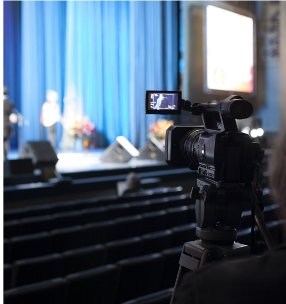
En performance-video skapas enkelt om ni har tillgång till en scen med bra ljussättning.

Det mesta går att lösa med en green screen nuförtiden. Då filmar ni mot en grön duk så att ni sedan kan lägga in vad ni vill för bakgrund/miljö i datorn. Mer om green screen kommer.