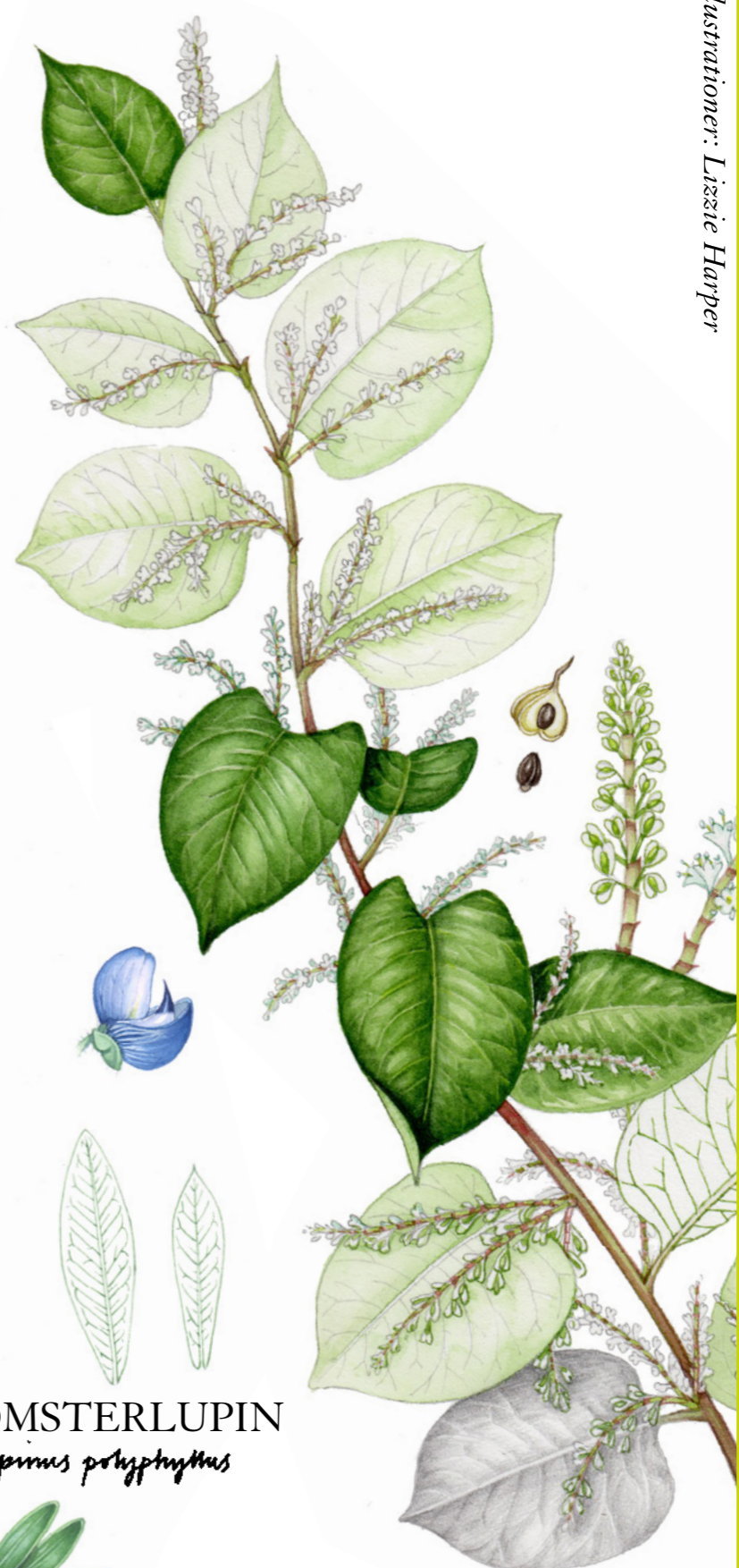
PARKSLIDE Reynoutria japonica