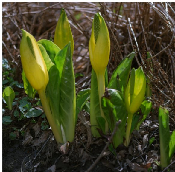
Gul skunkkalla.

Gemensamt för alla invasiva främmande växter är att de snabbt förökar sig. En alltför vanlig spridningsorsak beror på dumpning av trädgårdsavfall i naturen eller att trädgårdsavfallet har transporterats i öppet släp till kommunala återvinningsstationer och avsiktligt tappats längs vägen. Enligt undersökning är det närmare 10 % av trädgårdsägare som dumpar sitt växtavfall i naturen. Vanligt förekommande är att dumpas växtavfall utanför sin tomt, t.ex. på en allmänning.