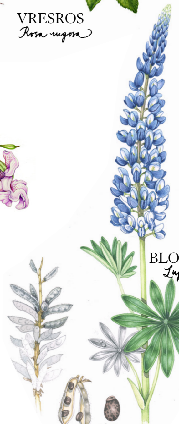
BLOMSTERLUPIN Lupinus polyphyllus