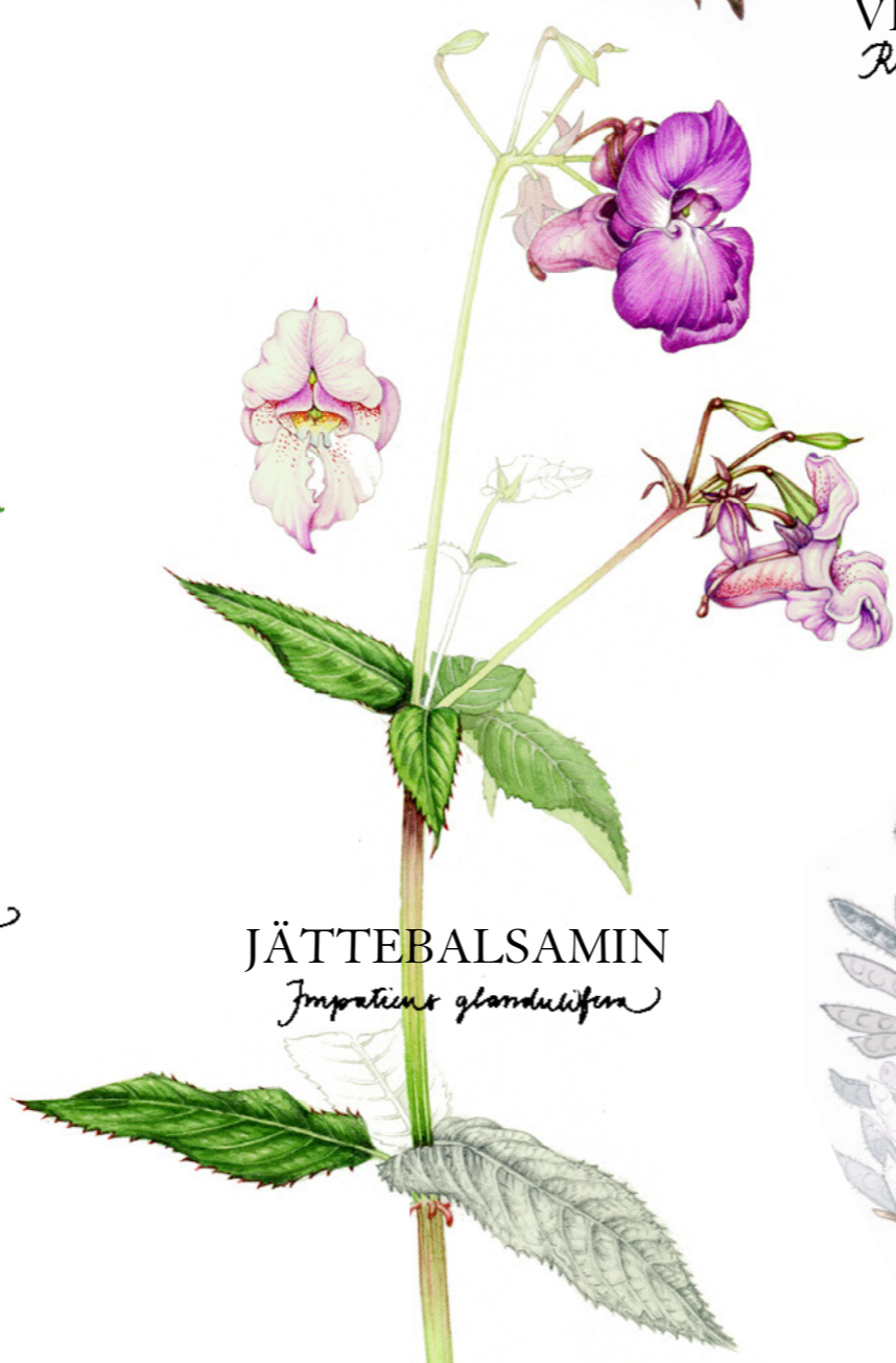
JÄTTEBALSAMIN Impatiens glandulifera