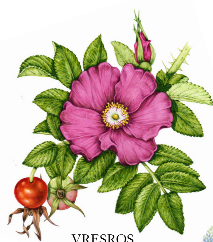
VRESROS Rosa rugosa