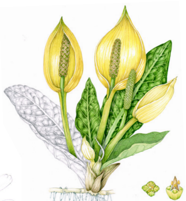
GUL SKUNKKALLA Lysichiton americanus