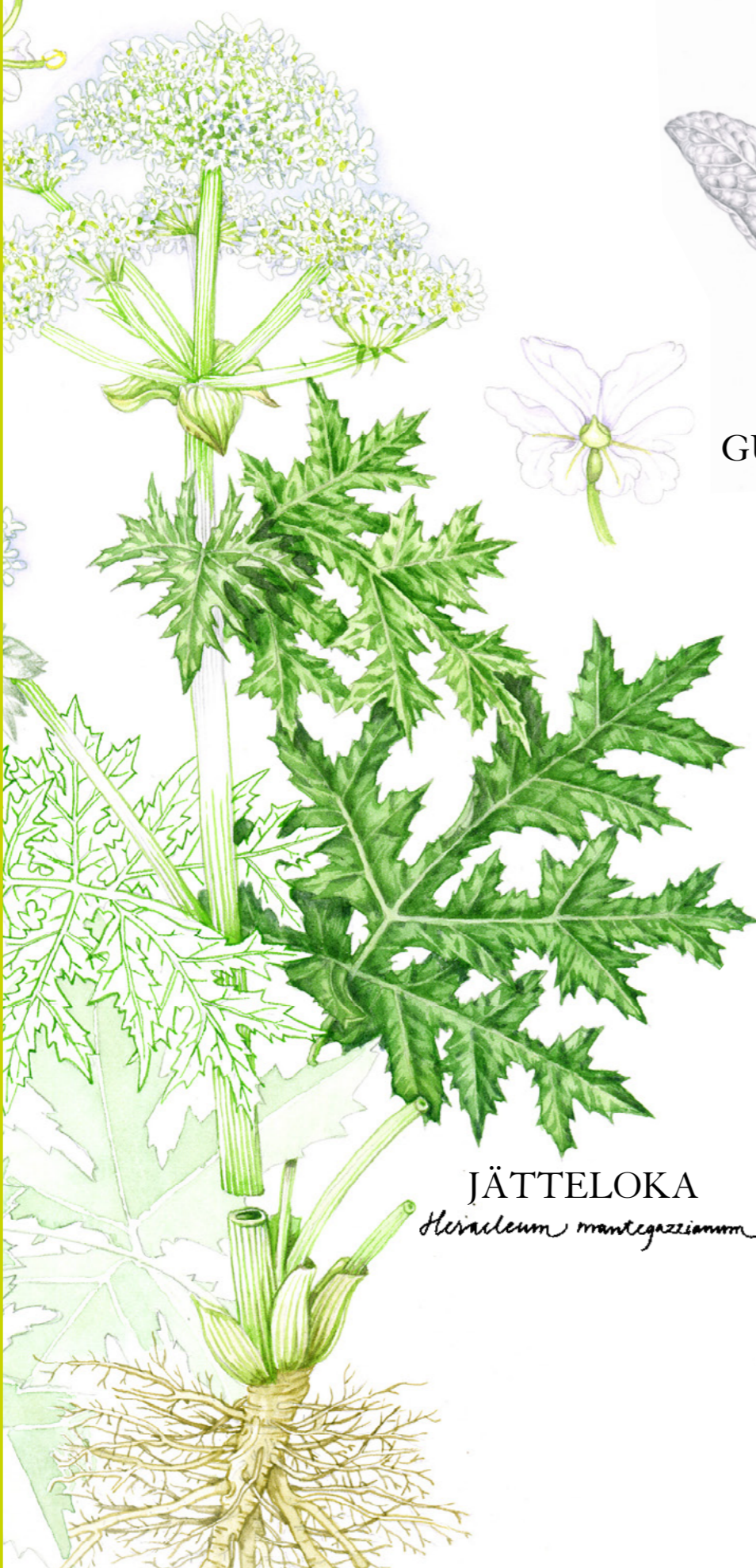
JÄTTELOKA Heracleum mantegazzianum