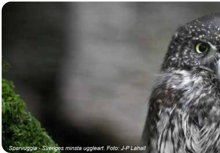
Sparvuggla - Sveriges minsta ugglearart.