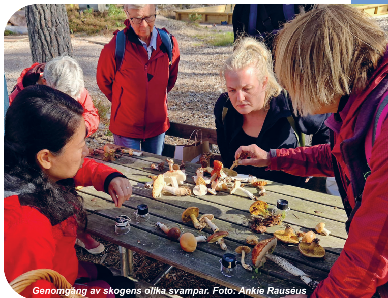
Genomgång av skogens olika svampar.

Vi besöker Ullavi klints naturresevat och letar svampar, ätliga och naturvårdsarter, i den spännande kalkbarrskogen i Kilsbergens förkastningsbrant. Vi går ca 6 km i delvis mycket kuperad terräng. Samling vid badplatsens parkering sydväst om Klockhammarsdammen. Tid: 10-14. Arr: Hopajola, Länsstyrelsen m fl.