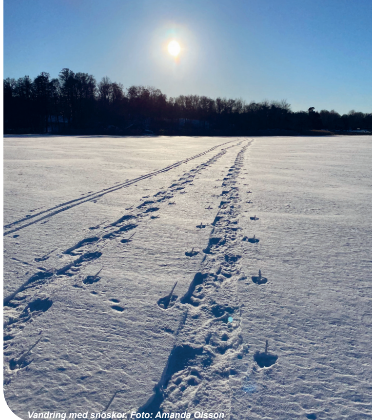
Vandring med snöskor.