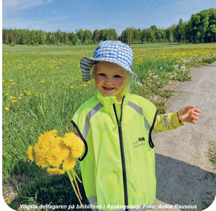
Yngsta deltagaren på bioblitz i Ässkogstorp.

Välkommen kl 14 till föreningens klubbstuga. Tag med picknick-korg. Arr: Ställdalens Naturstudieklubb.